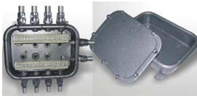
КП-48-00-(2)-38-00-Б4Г4В2-Г1/2-06-01-12 Комплект КП-48 (корпус + крышка)