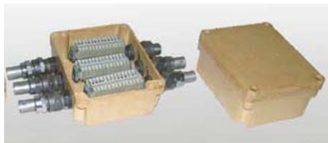
КП-24-00-(3)-42-00-БЗГЗ-Г1/2-05-0Х-12 Комплект КП-24 (корпус + крышка)

Коробки поставляются как в сборе (с кабельными вводами и клеммниками), так и комплектом для дальнейшей доработки лицензированным заказчиком по конкретным техническим требованиям на изделия, в состав которого она входит.